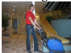
Vask over gulvet.