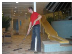
Fjern resterende vann