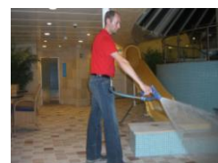
Spyl, og skrubb gulvet.