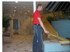
Påfør Antiskli Flis